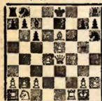
БУДАПЕШТ, 1896 Вальбродт