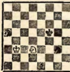
11. Крб3—с2ш ничья