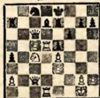
ГАВАННА, 1889 Стейниц