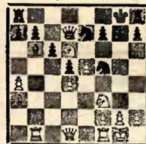
ГАВАННА, 1892 Стейниц