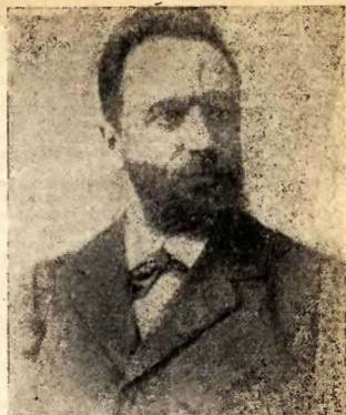
М. И. Чигорин (1850—1908).

выдвинувшая впоследствии нескольких мастеров. Правда, шахматная жизнь не выходила из рамок привилегированных слоев общества и интеллигенции, однако в условиях того времени нельзя было и помышлять о большем. Чигорин всеми силами боролся за пропаганду шахматного искусства. Ведь именно он впервые на страницах «Шахматного вестника» поднял вопрос о необходимости объединения русских шахматистов. «Организация и деятельность — вот пароль и лозунг за будущее процветание шахмат!», — писал Чигорин. Чигорину не удалось довести до конца начатое им дело борьбы за организацию шахматистов. С первых же шагов ему пришлось столкнуться с административным произволом, а затем с инертностью тех кругов общества, на которые он возлагал свои надежды. Клубы обычно являлись от поддержки отдельных меценатов, и естественно, что от настроения и прихоти последних зависела организация