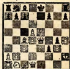
БРАЙТОН, 1903 Чигорин